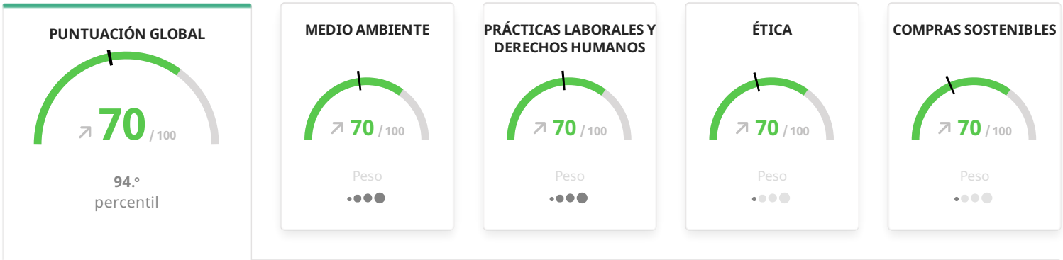
Distribución de la puntuación global

Desempeño en sostenibilidad ● Insuficiente ● Parcial ● Bueno ● Avanzado ● Destacado — Puntuación promedio